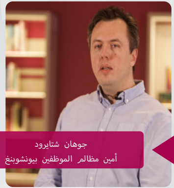
جوهان شتايرود أمين مظالم الموظفين بيونسويينغ