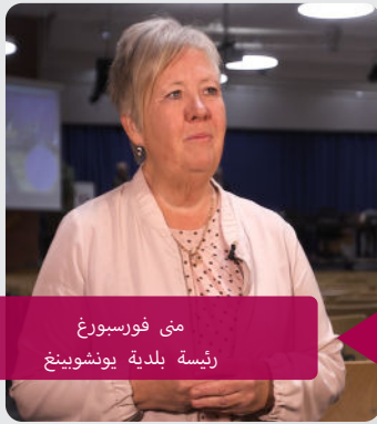
مى فورسبورغ رئيسة بلدية يونسويينغ