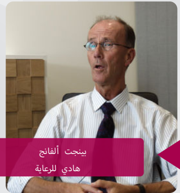
بينجت ألفانج هادي للرعاية