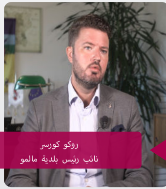
روكو كورسير نائب رئيس بلدية مالمو